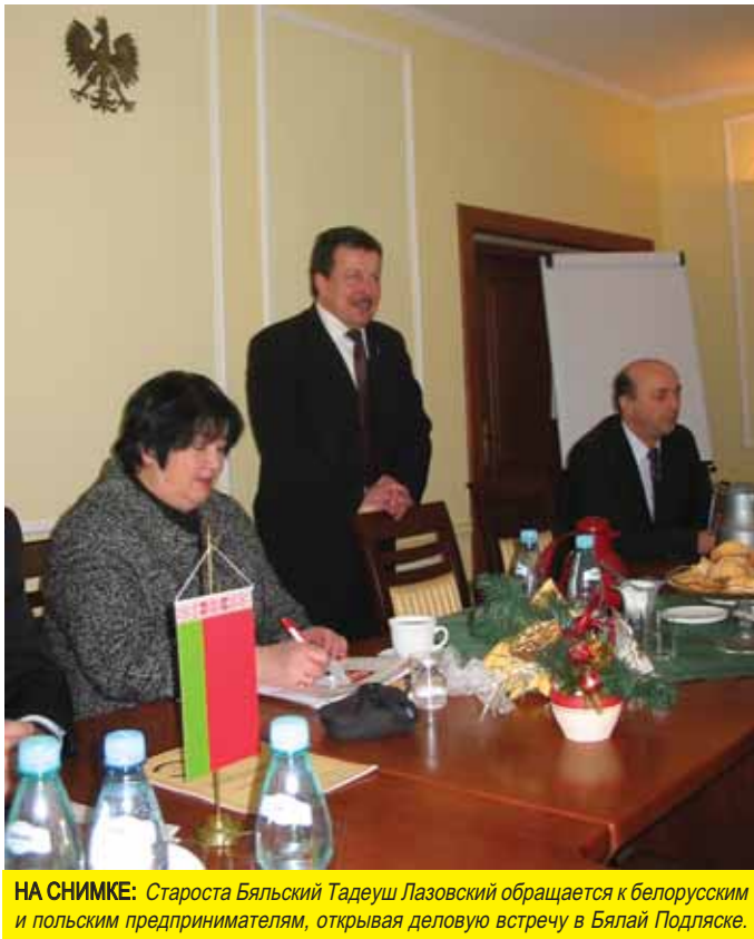
НА СНИМКЕ: Староста Бяльский Тадеуш Лазовский обращается к белорусским и польским предпринимателям, открывая деловую встречу в Бялой Подляске.