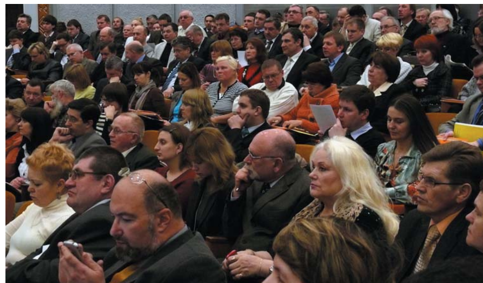
НА СНИМКЕ: 10 марта 2010 г. Участники Ассамблеи деловых кругов Беларуси обсуждают проблемы делового климата, а также способы их решения, предложенные в проекте "Национальной платформы бизнеса Беларуси-2010".

- Хороший вопрос! Иностранный капитал стремится заполучить перспективные предприятия и активы, обладая значительными финансовыми ресурсами. Но в этом заключается угроза для проведения цивилизованных рыночных реформ, достойного места малого частного бизнеса в структуре производства и обмена товаров и услуг. Решение наших проблем - только в партнерских отношениях с