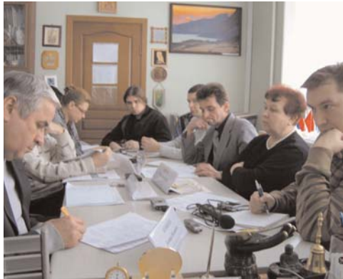
На снимке: участники пресс-конференции на тему «Защита прав собственности руководителей и предпринимателей».

В Союзе юридических лиц «Республиканская конфедерация предпринимательства» создан профильный комитет «Центр защиты прав собственности, руководителей и предпринимателей». В пятом номере республиканского правового издания «Юридическая газета» опубликован материал, подготовленный по итогам пресс-конференции, организованной пресс-центром ОО «ИССПР». Автор — известный белорусский журналист Леонид ЮНЧИК.