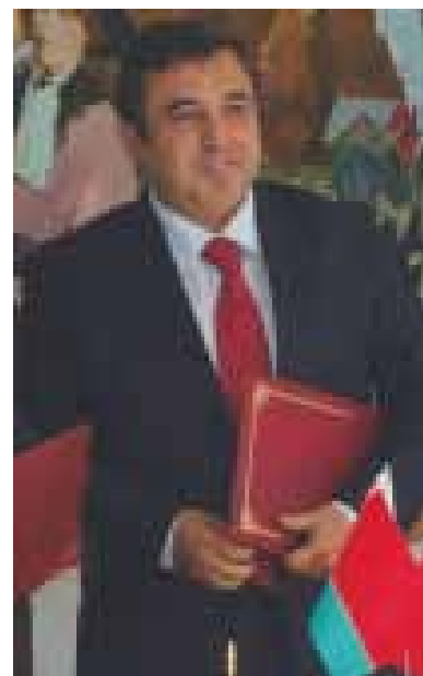
В рамках церемонии награждения победителей Республиканского конкурса «Лучший город (район) и область для бизнеса Беларуси – 2014» состоялось подписание Соглашения о сотрудничестве между СЮЛ «Республиканская конфедерация предпринимательства» и Белорусско-турецкой деловой ассоциацией. На фото: Председатель Белорусско-Турецкой деловой ассоциации «БЕ-ТИД» Альпаслан Сарыгез.

В связи с тем, что в последнее время возросла роль предпринимателей в реализации многочисленных социальных проектов, в этом году впервые был введен критерий «Участие предпринимателей региона в качестве спонсоров, благотворителей и меценатов в культурных, образовательных, экологических и иных социальных проектах (помощь учреждениям образования, культуры, спорта, здравоохранения и социального обеспечения, членство в благотворительных организациях и т.д.).»