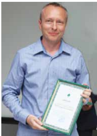
Главный редактор информационного агентства «Прайм-Тасс» Александр Хмельницкий.

предпринимателями центров поддержки предпринимательства, инкубаторов малого предпринимательства, индустриальных парков, технопарков, кластеров, центров субконтракции, центров трансфера технологий, центров молодежного предпринимательства;