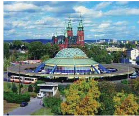
На снимке: Кельце – центр Свентокшистского воеводства.

Свентокшистское воеводство является регионом, содействующим налаживанию международных контактов равным образом в сферах экономической, политической и образовательной. Этому способствует: выгодное расположение и близость, как уже отмечалось, крупных городских агломераций – Варшавы, Кракова, Лодзи, Шлёнска, - присутствие целого ряда международных конвенций, действующих в регионе, – RR Donneley (США), MAN (Германия), NSK Bearings (Япония), Lafarge (Франция); хорошо подготовленные территории под инвестиции промышленного и услугового характера; второй по величине в Польше ярмарочный центр; высококвалифицированные кадры работников; богатые промышленные традиции; сравнительно более низкая в масштабах страны стоимость рабочей силы; молодые, хорошо образованные люди, знающие иностранные языки (45 тысяч студентов); хорошо развитая учебная база; природные и климатические ценности. Активность и международное сотрудничество органов самоуправления Свентокшистского воеводства являются важнейшими инструментами создания современного и гармоничного развития воеводства во всех областях, в том числе образования и науки, экономики и инноваций, региональной энергетической политики, здоровья и социальной политики, охраны и