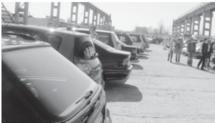
12 гадзін — зацішка.