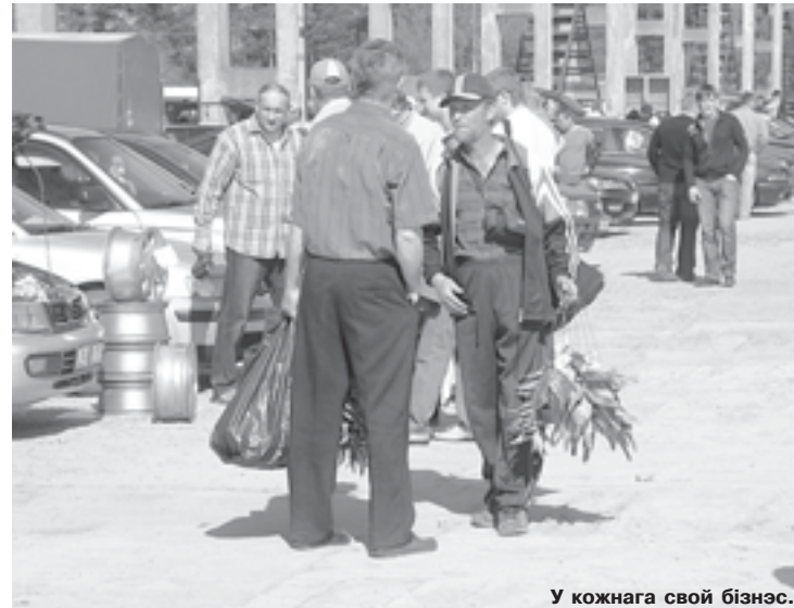
У кожнага свой бізнэс.

А калі тую машыну купляць, калі не ў апошні месяц вясны?! Відаць, многія, хто хацеў бы на-