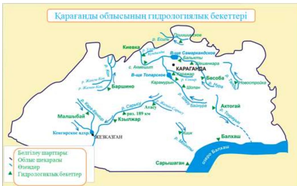
5 сурет. Қарағанды облысының гидрологиялық бекеттері

2018 жылы "Қазгидромет" РМК жұмыс жоспарына сәйкес Қарағанды облысының аумағында 19 гидрологиялық бекетте: 17 өзен және 2 көл бекеттерінде бақылау жүргізілді (5 сурет). Бекеттер облыстың негізгі су объектілерін бақылаумен қамтиды.