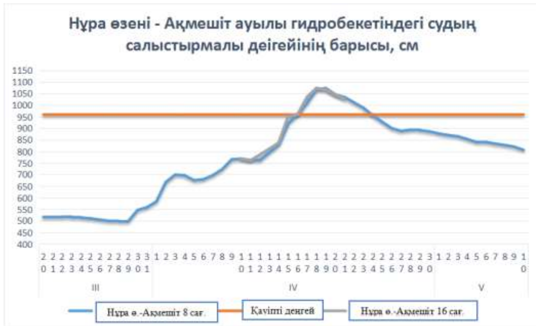
4 сурет. Нұра өзені - Ақмешіт ауылы гидробекетіндегі судың салыстырмалы деңгейінің барысы

Шерубайнұра өзені бассейнінің төменгі бөлігінде қарқынды қар еруі гидрологиялық бекет ауданында жоғары ағысқа қарағанда әлдеқайда ерте