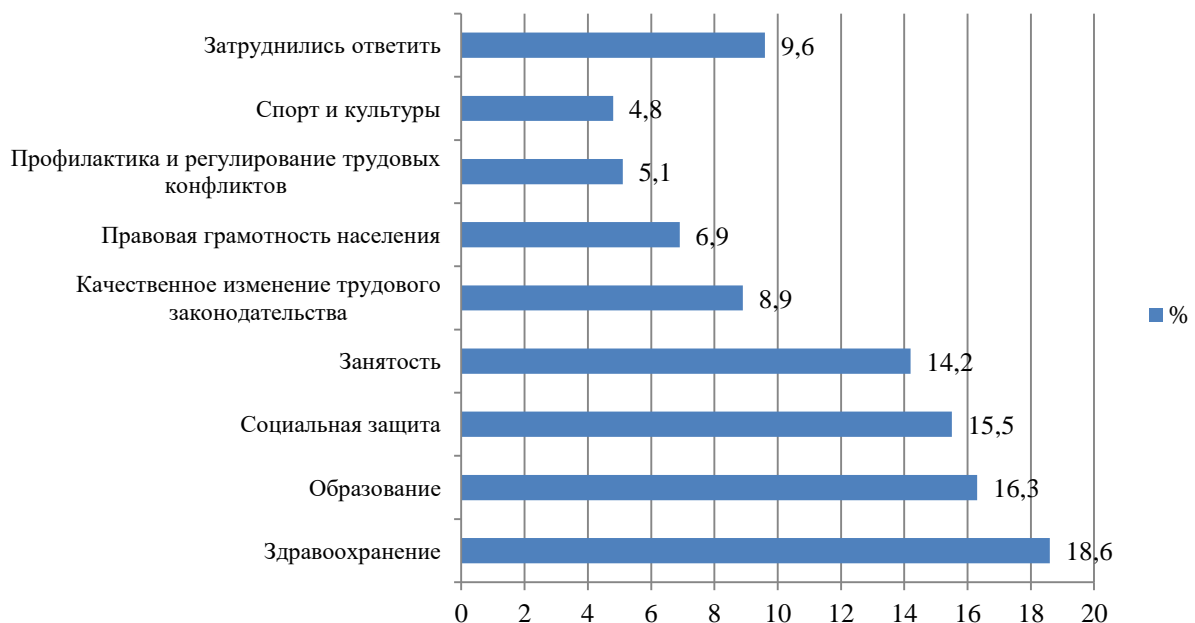
Рисунок 1– Распределение ответов казахстанских граждан на вопросы о том, какие приоритеты социальной модернизации они считают наиболее значимыми в масштабах страны

Отметим, что система обязательного социального медицинского страхования, получившая распространение в масштабах всего мира, включая страны СНГ, представляет собой способ социальной защиты граждан в сфере здравоохранения. Она привлекательна для стран в силу возможности независимой экспертизы качества оказываемых услуг здравоохранения, накопления внебюджетных средств на медицинское обслуживание за счет взносов работодателей, гарантированной оплаты предоставленных медицинских услуг из фонда средств, а гражданам позволяет избежать больших единовременных расходов в случае заболевания.