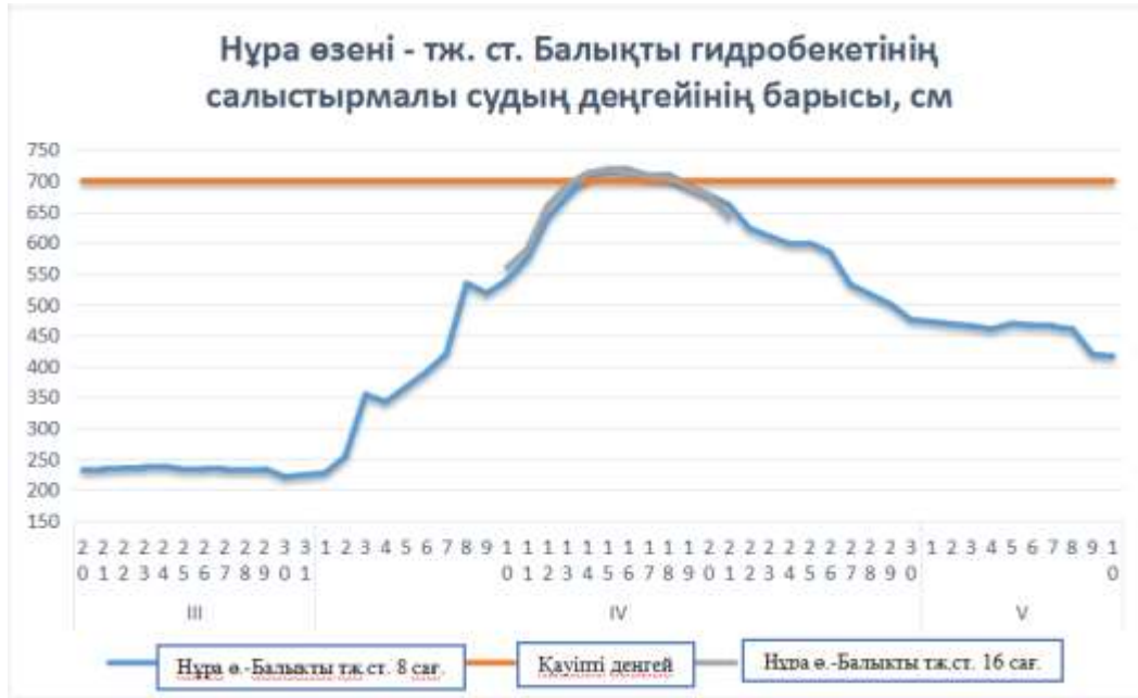
3 сурет. Нұра өзені - Балықты тж. ст. гидробекетінің салыстырмалы судың деңгейінің барысы