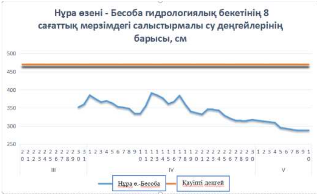
1 сурет. Нұра өзені - Бесоба гидрологиялық бекетінің 8 сағаттық мерзімдегі салыстырмалы су деңгейлерінің барысы