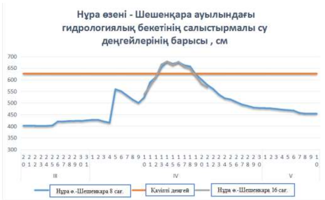
2 сурет. Нұра өзені - Шешенқара ауылындағы гидрологиялық бекетінің салыстырмалы су деңгейлерінің барысы

Нұра өзенінде орналасқан 3 гидрологиялық бекетте су тасқыны кезінде судың қауіпті деңгейі асып кетті: Шешенқара кенті-13-18 сәуір, Балықты станциясы-14-18 сәуір аралығында, Ақмешіт -16-23 сәуір аралығында (4 сурет).