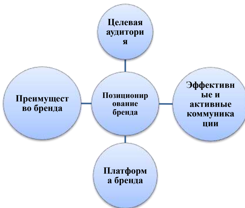
Рисунок 1 - Характеристики позиционирования бренда

Рассмотрим четыре важные особенности позиционирования бренда (рис.1).