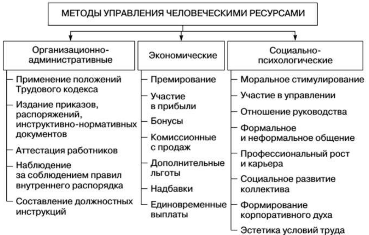
Рисунок – 1 Систематизация методик управления человеческими ресурсами

Социально-психологические методики управления базируются на применении морального стимулирования к трудовой деятельности и воздействию на личность посредством психологических способов с целью направления административной задачи в определенную обязанность.