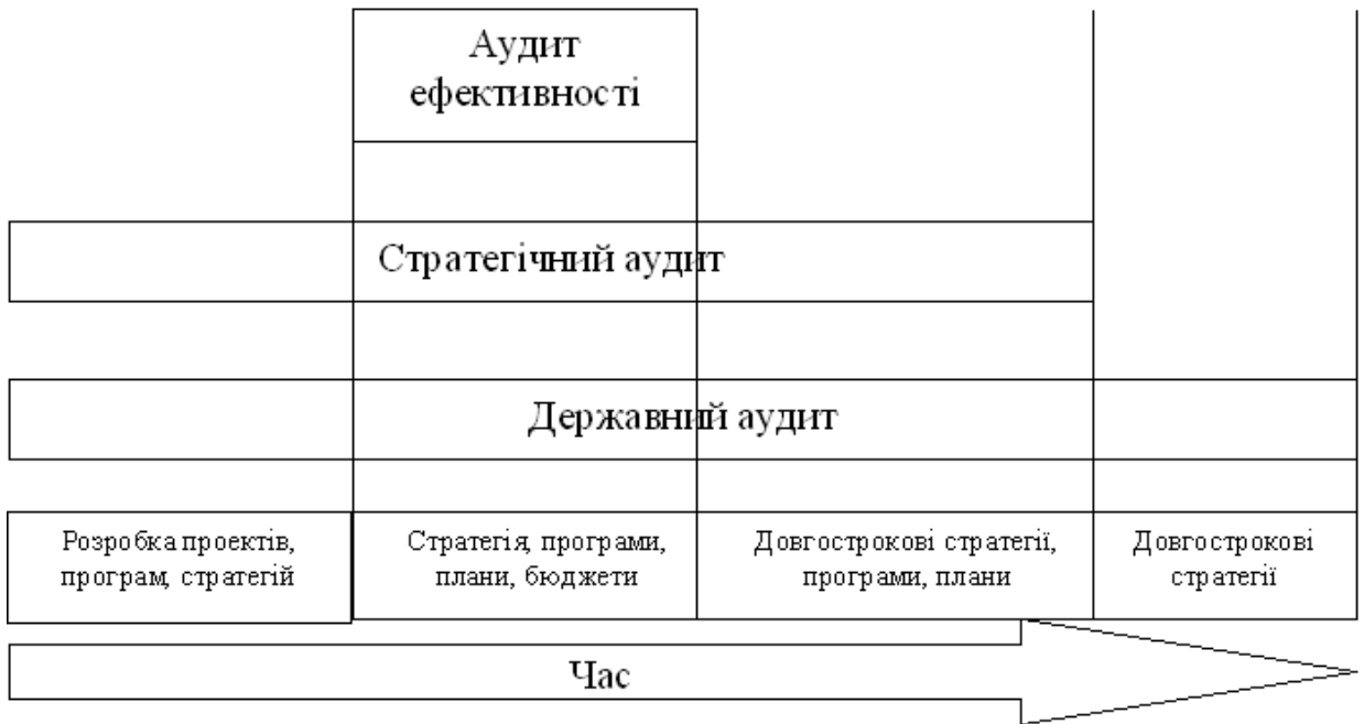
Рис. 1. Часові рамки аудиту, здійснюваного суб'єктами фінансового контролю

Відмінності зазначених аудитів наведені на рис. 1.