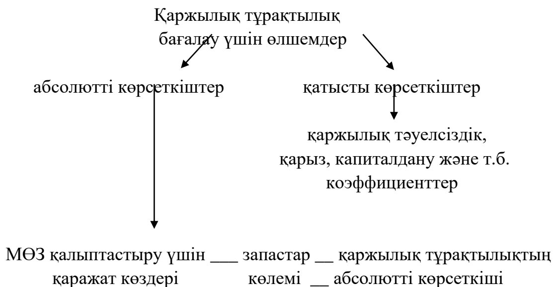
Сурет 1. Кәсіпорынның қаржылық тұрақтылығын сипаттайтын көрсеткіштер

Өндірістік процесс барысында кәсіпорында тауарлы-материалдық қорлардың үнемі толығып отыруы болады (1-сурет).